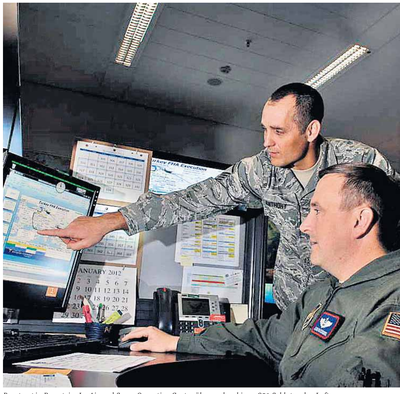
Beratung in Ramstein: Im Air and Space Operation Center überwachen bis zu 650 Soldaten den Luftraum.

Über Eintausend Soldaten und Zivilisten arbeiten derzeit für das Kommando in Stuttgart, unter anderem auch Geheimdienstmitarbeiter und „All-Source“-Ana-